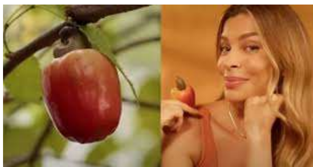
Fig. 01 – Campanha “É Tempo de Caju na Pele”

Todos os elementos presentes em uma campanha publicitária são estrategicamente pensados para gerarem resultados significativos e eficientes para as marcas, e isso não seria diferente com a marca de cosméticos L'Occitane, que em outubro de 2023 veiculou em suas plataformas digitais a campanha “É Tempo de Caju na Pele”, protagonizada pela atriz Grazi Massafera.