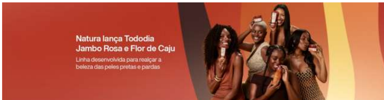
Fig. 02 – Campanha Natura (2020)